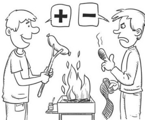
Rys. S. Kilian

Wykorzystanie debaty „za” i „przeciw” umożliwia uczniom spojrzenie na to samo zagadnienie z dwóch odmiennych punktów widzenia oraz ułatwia podjęcie decyzji czy dokonanie oceny. Metoda ta może być wykorzystana przy omawianiu kontrowersyjnych tematów. Zadaniem uczniów jest zaprezentowanie argumentów „za” i „przeciw” oraz przekonanie innych do swoich poglądów. Uczniowie dowiadują się, jak należy dyskutować, wyrażać swoje zdanie bez prowokacji i osobistych ataków. Wprowadzając tę metodę, nie należy narzucać uczniom swojego punktu widzenia. Każda grupa musi mieć taki sam czas na wypowiedź.